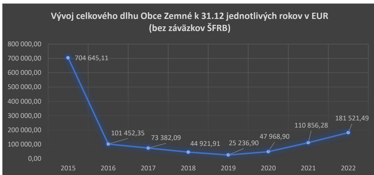
Graf č. 3. Vývoj celkového dlhu obce Zemné k 31.12. jednotlivých rokov v EUR

Celk. dlh obce = (hodnota úveru / bežné príjmy obce z roku 2021)*100